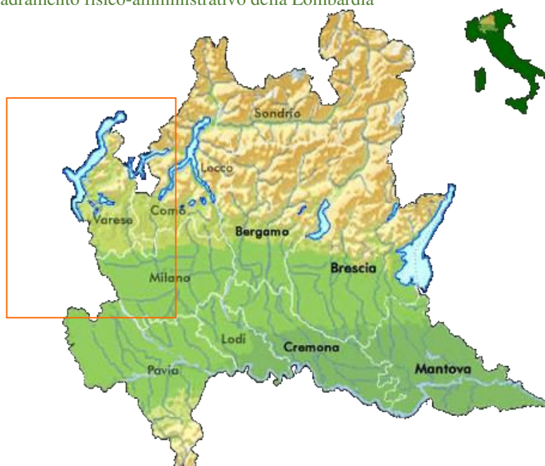
Figura 1 - Inquadramento fisico-amministrativo della Lombardia

La provincia di Varese risulta suddivisa amministrativamente in 139 comuni, di cui di seguito si forniscono i dati di superficie territoriale ed altitudine.